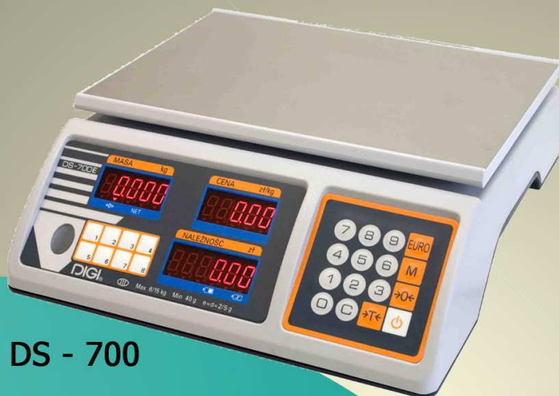
DS - 700